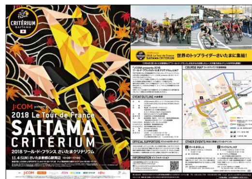
チラシ2版 (左→表面、右→裏面)