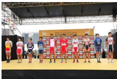
女子選手、男子ジュニア選手、 アマチュア選手セレモニー