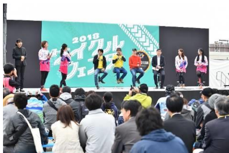
サイクルフェスタトークショー

上記レースの前日と当日に、自転車競技の魅力を広く伝えるとともに、自転車利用の促進や交通マナーの意識向上を図るイベントを、クリテリウムコース付近において実施した。ステージでの片山右京らによるトークショーのほか、特設周回コースを設置したキッズロアなどを行った。