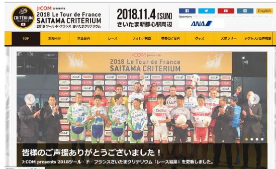
大会公式ホームページ