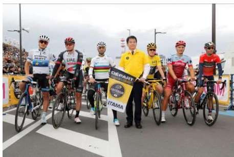
スタート前の選手達