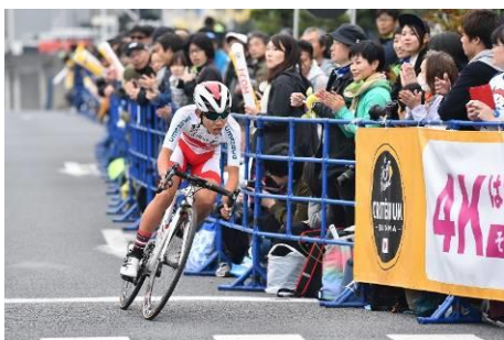
個人タイムトライアルレース①

女子選手は、エリート、ジュニアなどの各カテゴリーの上位選手4名がJCFにより選出され、パラサイクリング選手は、ハンドバイク、三輪自転車、タンデム、競技用自転車の4種から、世界選手権優勝者を含む9名がJPCFにより選出された。アマチュア選手は、9月に初めて開催した予選会を勝ち上がった男子、女子、男子ジュニアの各カテゴリー1名ずつ3名を招待した。