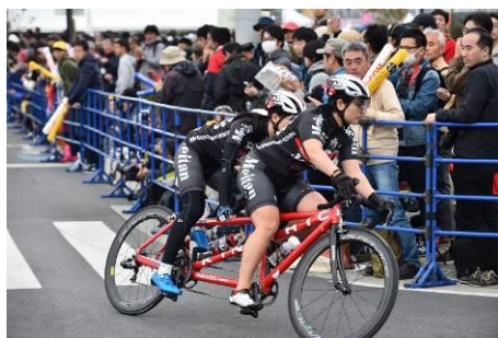
個人タイムトライアルレース②

また、個人タイムトライアルレースに参加した女子選手、男子ジュニア選手、パラサイクリング選手及びアマチュア選手を紹介した。