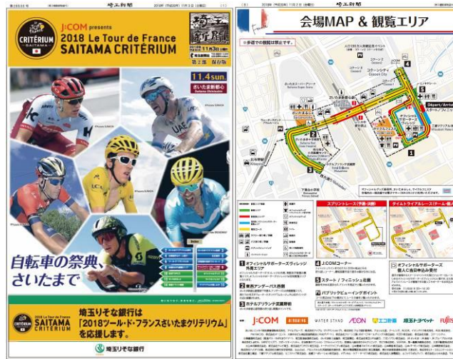
埼玉新聞号外(左→表紙、右→広告枠の一部)