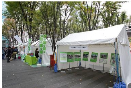
パラサイクリング啓発ブース