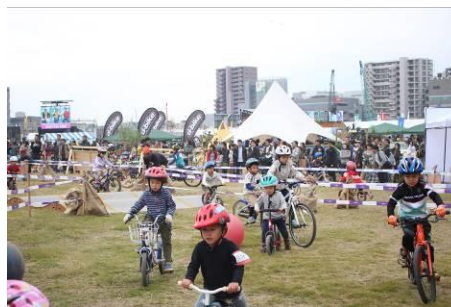
キッズロアの様子