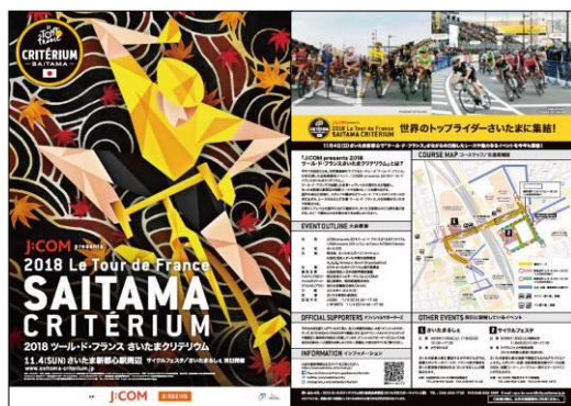
チラシ1版 (左→表面、右→裏面)