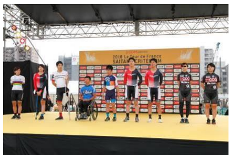
パラサイクリング選手セレモニー