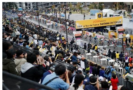
大観衆の中を疾走する選手達